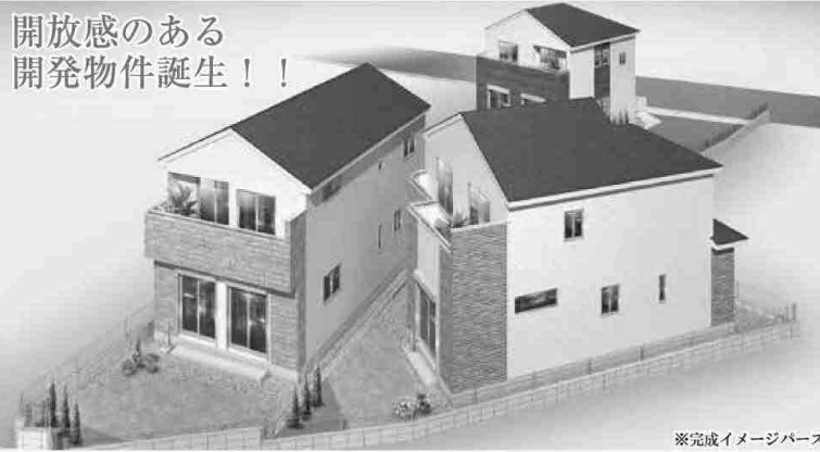
※完成イメージパース