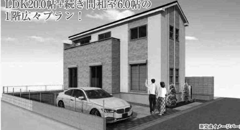
※完成イメージパース